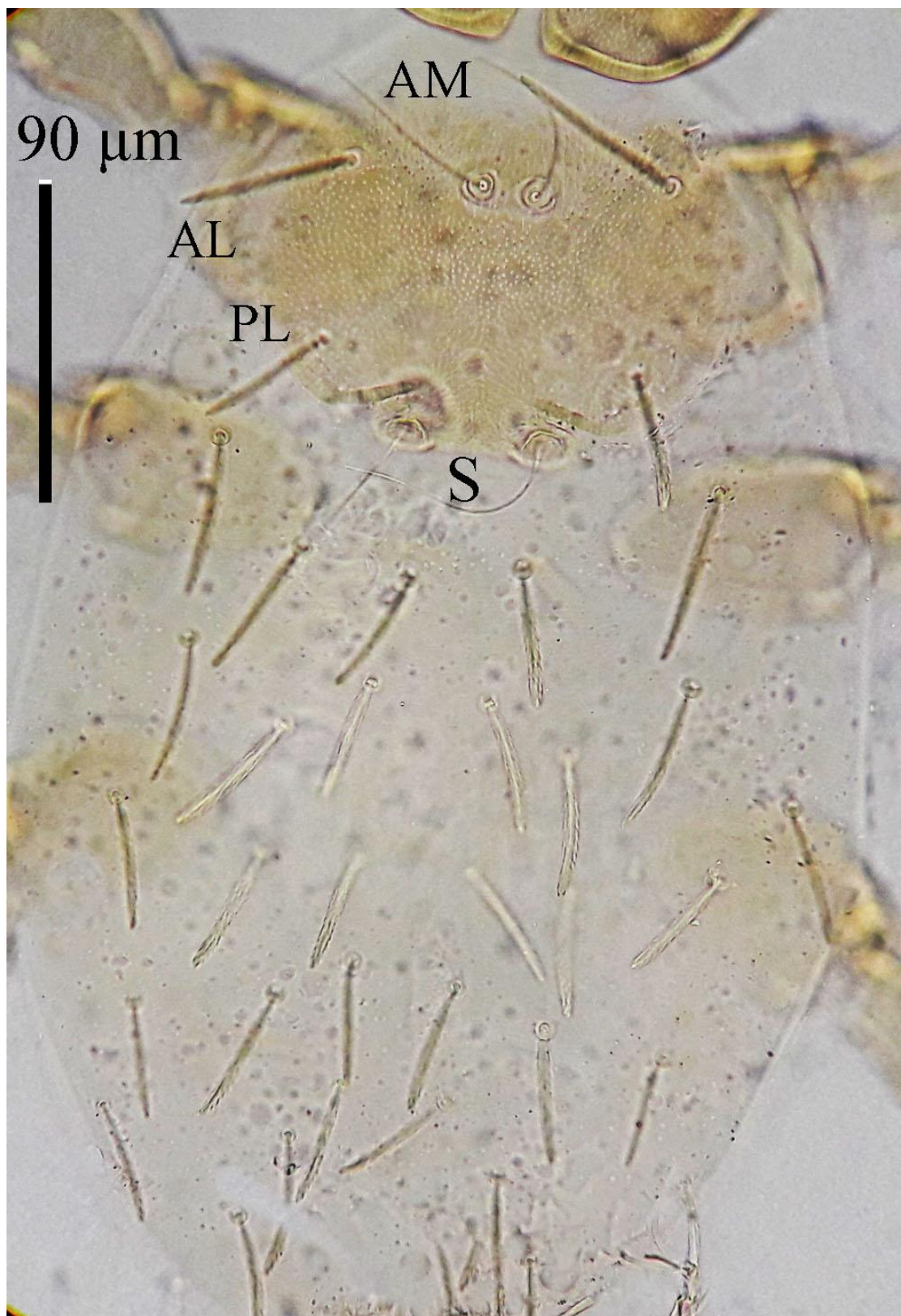
شکل ۱- سطح پشتی بدن در گونه Eatoniana gonabadensis (Ahmadi, Hajiqanbar and Saboori, 2012) (اصلی) Figure 1. Dorsal view of Eatoniana gonabadensis (Ahmadi, Hajiqanbar and Saboori, 2012) (original)