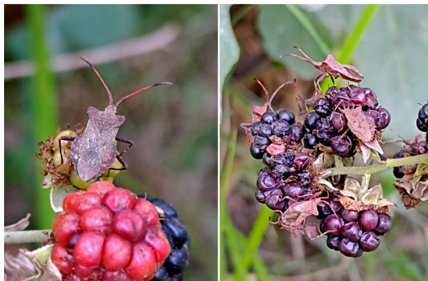
شکل ۲- گونه Coreus marginatus marginatus (Linnaeus, 1758) و خسارت ناشی از آن روی میوه تمشک سیاه بی خار.