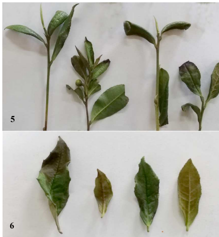
شکل های ۵-۶. علائم خسارت کنه Polyphagotarsonemus latus روی چای: (۵) سرشاخه و جوانه های خسارت دیده (۶) برگ های خسارت دیده